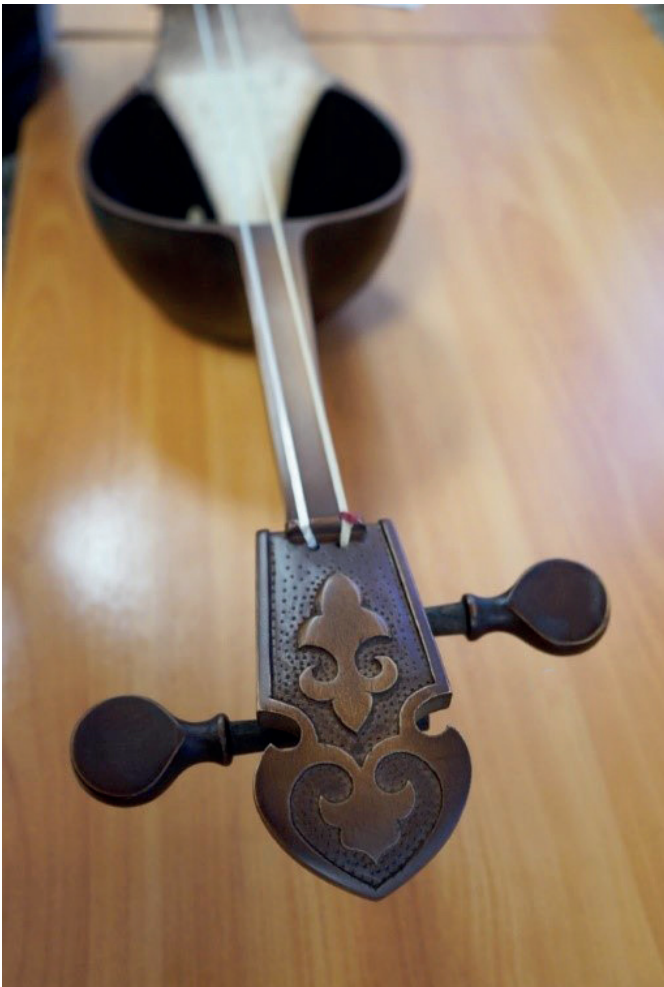
Колки и орнамент на грифе

Мне самому удивительно, как я – человек без музыкального образования изготавливаю инструменты, которые все называют уникальными.