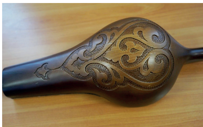
Орнамент на обратной стороне резонатора