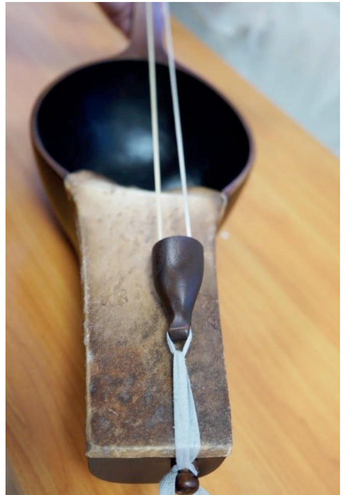
Резонаторная кожа и струнодержатель

С инструментами меня приглашают на многие выставки и торжественные мероприятия. По приглашению Министерства культуры Республики Татарстан я участвовал на художественно-промышленной выставке-форуме «Уникальная Россия», которая проходила в Москве. Участвовал в специальной выставке производителей музыкальных инструментов в Казанской ратуше, где с моими работами ознакомился наш президент Рустам Нургалеевич Минниханов. Также был приглашен участником на выставку в честь юбилея нашего первого президента Минтимера Шариповича Шаймиева.